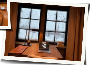
Till höger: Arbetsplatshörnan i sovrummet.