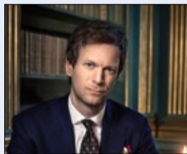
Niklas Natt och Dag har två böcker på listan.

■ Källa: Svenska Bokhandlareföreningen och Svenska Förläggareföreningen. Siffran efter placeringen anger förra veckans placering.