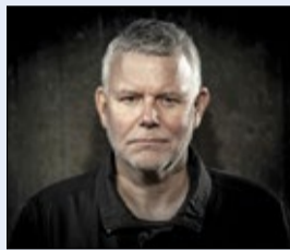
Arne Dahls "Islossning" ny fyra.